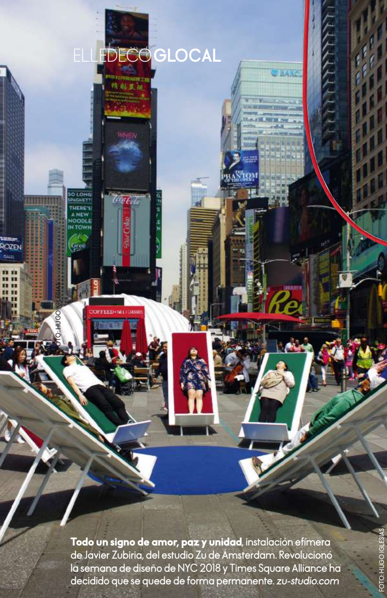
Todo un signo de amor, paz y unidad, instalación efímera de Javier Zubiria, del estudio Zu de Ámsterdam. Revolucionó la semana de diseño de NYC 2018 y Times Square Alliance ha decidido que se quede de forma permanente. zu-studio.com